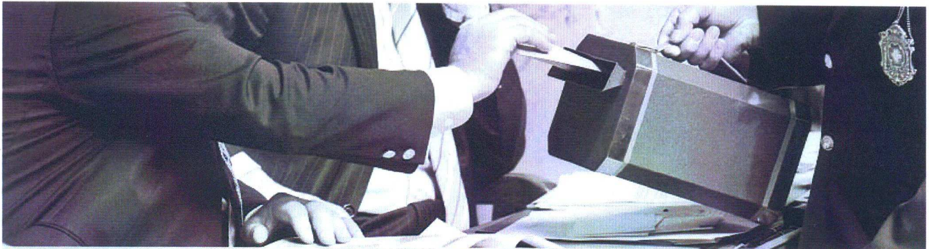
DAUERBRENNER. Die Initiative für eine Volkswahl des Bundesrates liegt seit Jahren pfannenfertig in den Schubladen der SVP-Parteileitung. Schon am Wahlabend im Oktober 2003 verknüpfte die Partei ihre Forderung, Christoph Blocher in den Bundesrat zu wählen, mit