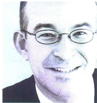
GREGOR RUTZ (34) ist Generalsekretär der SVP Schweiz und wohnt in Küsnacht (ZH).

Es ist Zeit, nachzuholen, was die Gründer der modernen Schweiz 1848 aufgrund der damaligen speziellen Konstellation nicht einführen konnten: die Volkswahl unserer Landesregierung.